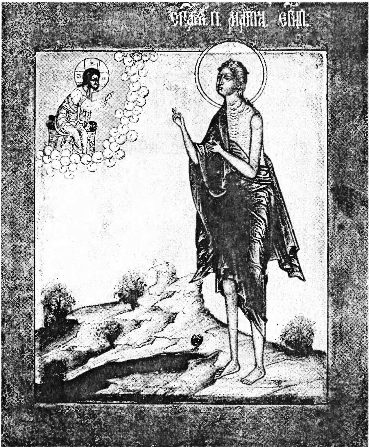
Преподобная Мария Египетская